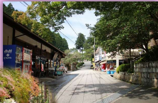
大窪寺門前に並ぶ商店