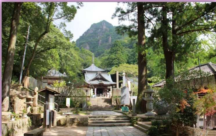
第 88 番札所 大窪寺