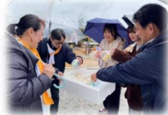
▲ お接待は49チーム390名が参加。飲食物・手作り小物・お守りなどをお接待。