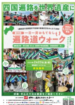
▲ 第9回案内チラシ 今回からポスターも作成し幅広く告知をおこなった。